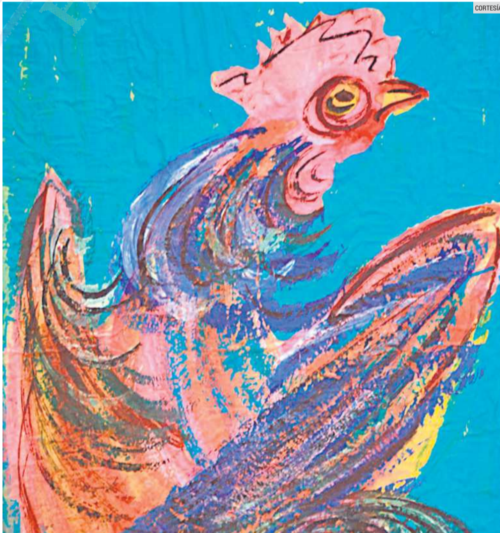
ARTE. Obra de "Chucho" Reyes, la cual se caracteriza por el inconfundible uso del color, donde resaltan los tonos rosas, azules, rojos y amarillos.

En la Sala 13 del Circuito Sur está "Flujo aleatorio" de Edgar Cobián; la cual permanecerá abierta hasta el 28 de julio del 2024. La obra de Edgar Cobián (Guadalajara, 1978) ha